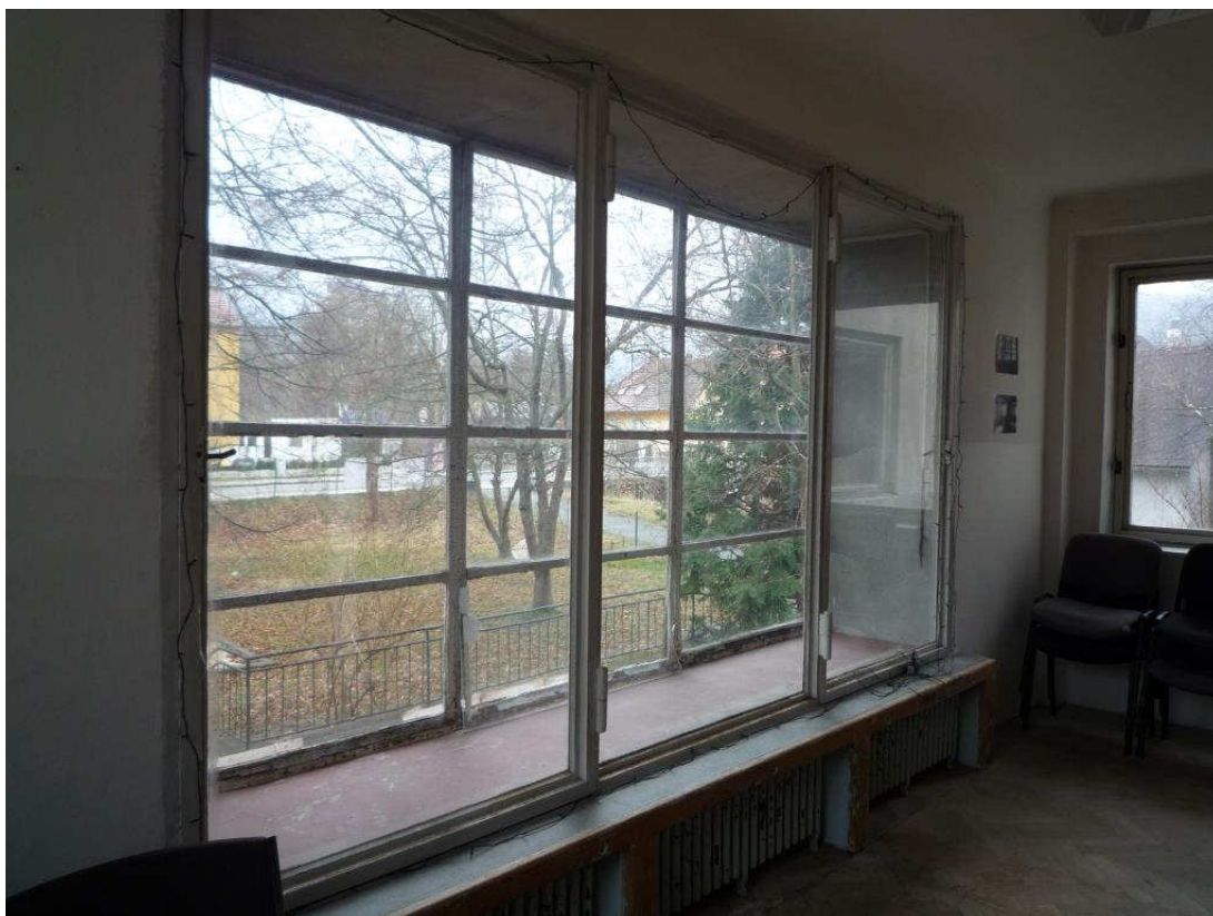
Obr. č. 3: Interiér, detail okna