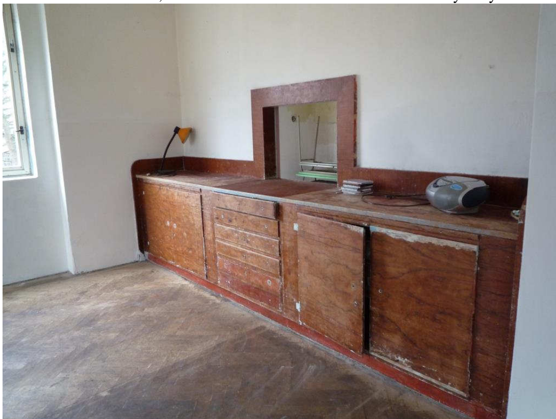
Obr. č. 4: Původní vestavěný nábytek