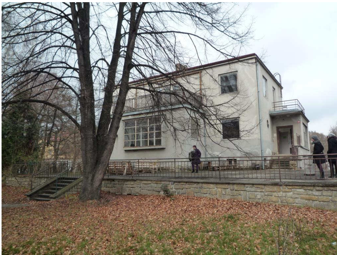
Obr. 1: Exteriér a celkový pohled na „Dům J.N.Krale“ Obr. č. 2: Detail balkonu a zábradlí

Fotodokumentace rodinného domu Johanna Nepomuka Krale v ulici Nádražní č.p. 364, na pozemku st.p.č. 643, k.ú., obec a okres Prachatice, Jihočeský kraj: