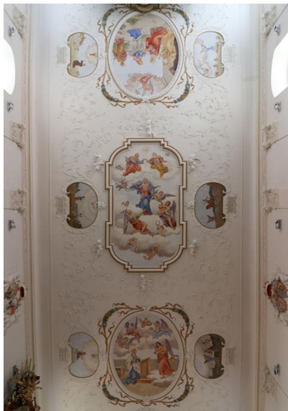
Strop hlavní lodi - etapa roku 2017