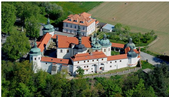
Poutní areál v Klokotech - letecký pohled

celkové náklady v roce 2017: 2 660 000 Kč