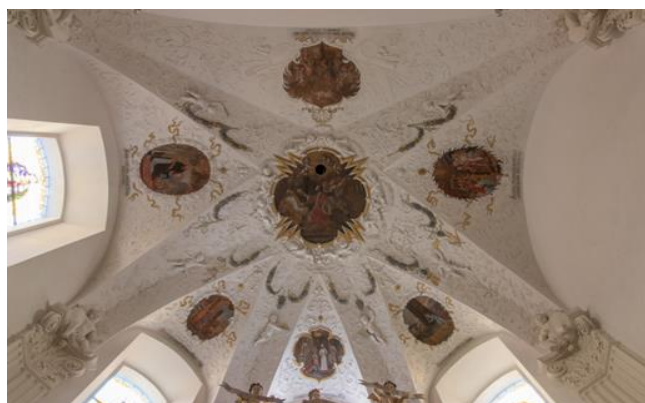
Strop kaple sv. Václava