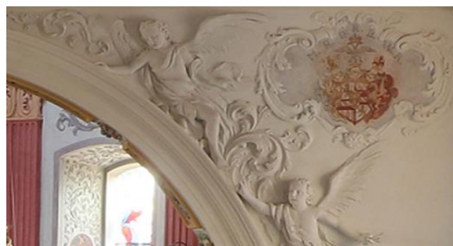
Triumfální oblouk - detail štukové výzdoby