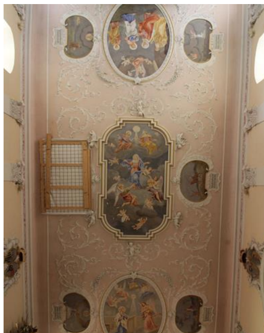
Stav výzdoby interiéru kostela před obnovou