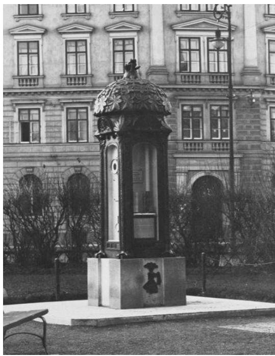
Historický snímek z roku 1913