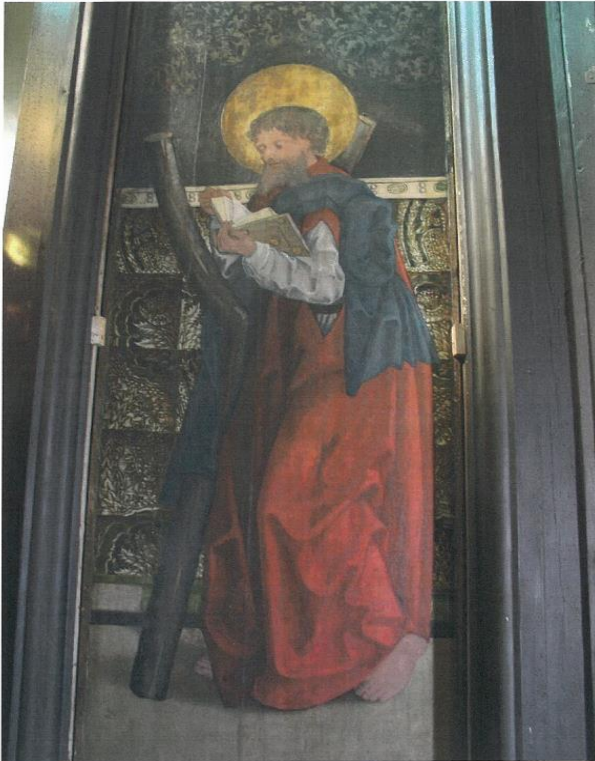
pravé křídlo gotické archy s oboustranným obrazem sv. Kryštofa (na čelní straně) a obrazem sv. Ondřeje (na rubové straně) – stávající stav obrazu sv. Ondřeje – celkový pohled