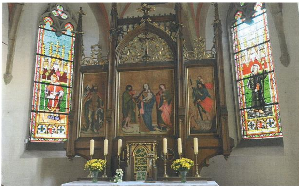
gotický křídlový oltář zv. Chudenická archa – celkový pohled z čelní strany

finanční příspěvek: 100 tis. Kč - cena prací 112 700,- Kč