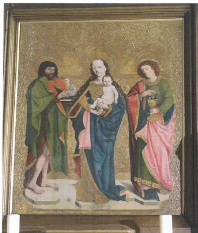
centrální obraz „Madona se sv. Janem Křtitelem a sv. Janem Evangelistou“