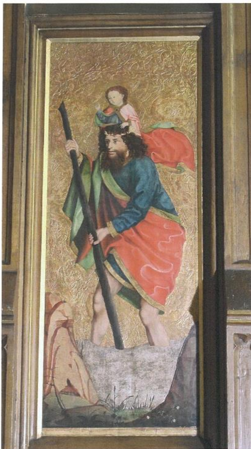
pravé křídlo gotické archy s oboustranným obrazem sv. Kryštofa (na čelní straně) a obrazem sv. Ondřeje (na rubové straně) – stávající stav obrazu sv. Kryštofa – celkový pohled