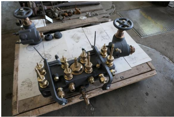
Opravená armaturní hlava byla opatřena finálním matně černým nátěrem