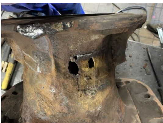
Prorezlý a proudem páry vyšlehaný otvor v litém tělese výfukového stojanu