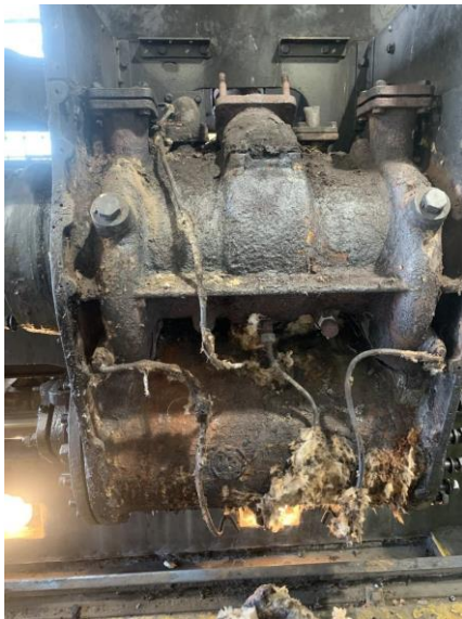
Demontáž izolační vaty z bloku pravého válce