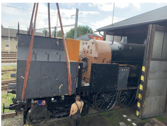
Montáž uhláku na rám lokomotivy