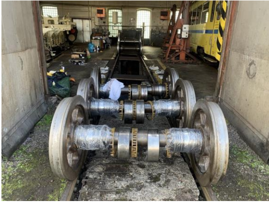
Běžné osy s rozebranými klecemi svých válečkových ložisek