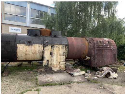
Z vyvázaného kotle bylo sejmuto oplechování a stará izolační vata