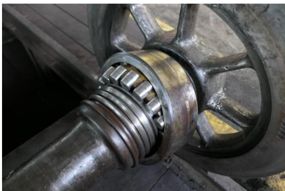
Všetchna válečková ložiska běžných os prošla demontáží, vyčištěním a kontrolou