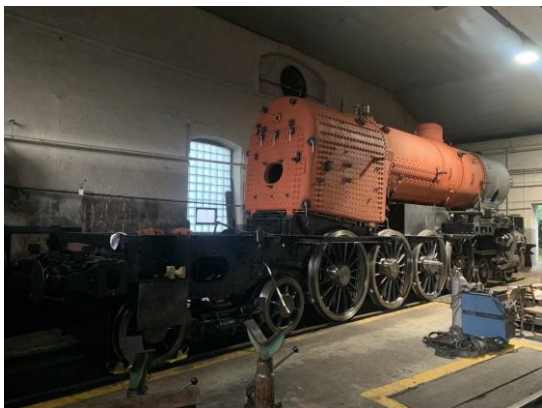
Zavázání kotle a dvojkolí do rámu