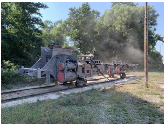
Rám lokomotivy byl zbaven starých nátěrů a nečistot pískováním