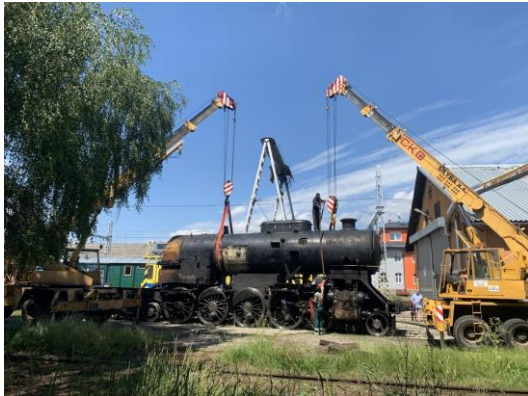
Vývaz kotle z rámu lokomotivy