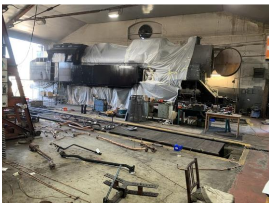
Finální nátěr lokomotivy probíhal po částech