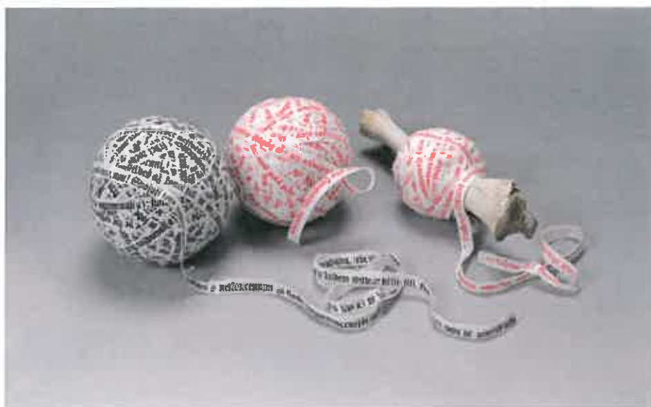
Monogramista T. D.