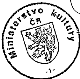
MUDr. Jiří Besser ministr kultury

Proti tomuto rozhodnutí lze podle ustanovení § 152 odst. 1 zákona č. 500/2004 Sb., správní řád, v platném znění, podat ve lhůtě 15 dnů od jeho doručení rozklad. O rozkladu proti tomuto rozhodnutí rozhoduje ministr kultury. Rozklad se podává u Ministerstva kultury, Maltézské náměstí 471/1, 118 11 Praha 1 - Malá Strana nebo elektronicky na adresu epodatelna@mkcr.cz .